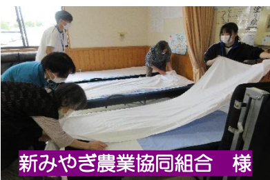
新みやぎ農業協同組合 様