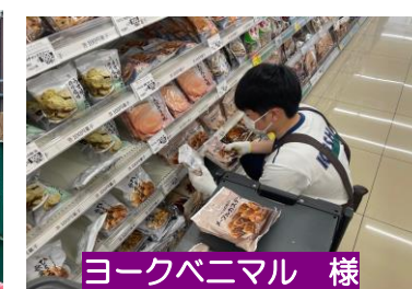
ヨークベニマル 様