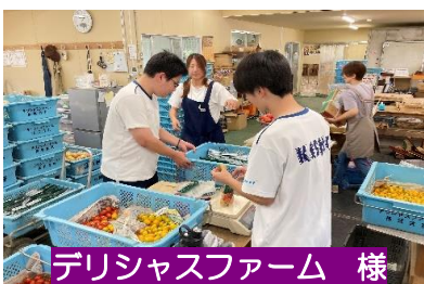
デリシャスファーム 様