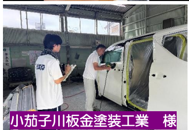
小茄子川板金塗装工業 様