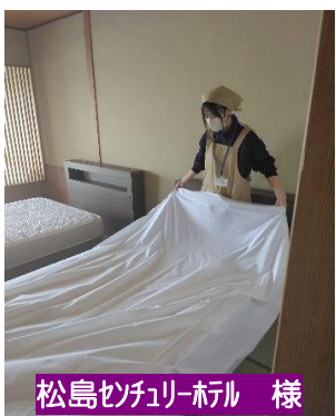
松島ファミリーホテル 様