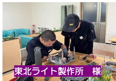
東北ライト製作所 様